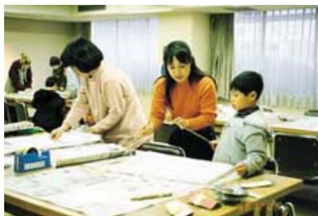
「冬休みキッズチャレンジ」凧作り

また、月に二回、「おはなしの森」でボランティアによる絵本の読み聞かせやエプロンシアター、「親子チャレンジ教室」では、親子でパン作りや腹話術などに挑戦、乳幼児をもつ保護者には、「お母さんのびのびスクール」で家庭教育に関する講演や実技を学ぶ機会を設け、育成センターでは、「子育て懇談会」を開催するなど、家庭教育の充実を図り、未来を担う子どもたちの健全な育成に努めています。