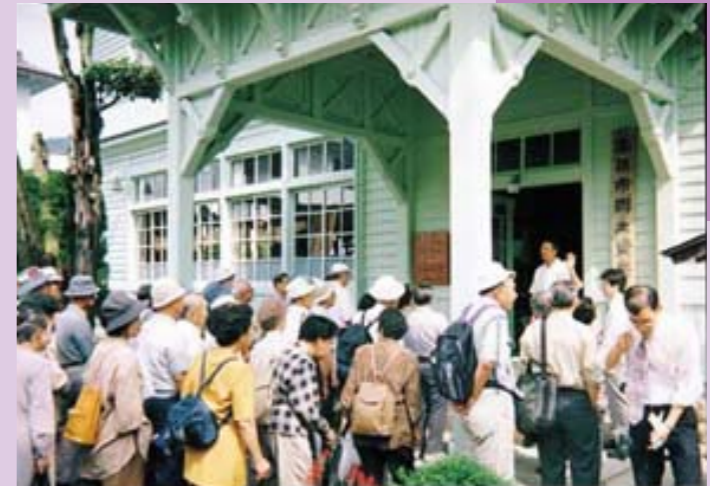
岡山県の歴史について、くらしと戦いを中心に学習しました。(写真は高梁市での現地見学)