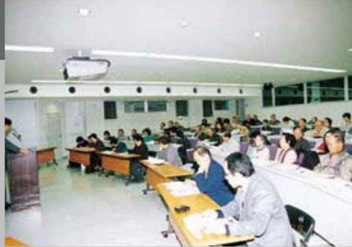
郷土出身の文学者の生涯や作品、岡山県の建築物などについて学習しました。(写真は文学の講座の一場面)