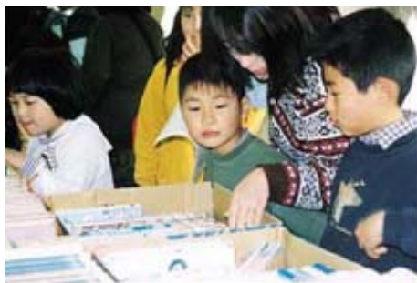
「生涯学習のつどい」古本リサイクル市

毎年二月には、生涯学習の拠点施設、備前市市民センター全館をあげて、「備前市生涯学習のつどい」を開催します。功労者の表彰や、学習活動の紹介・展示・記念講演、古本リサイクル市、こども映画館、健康コーナーなどで館内は一日中賑わいます。