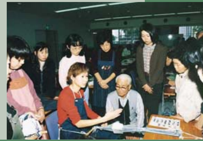
「民藝とは何か」「郷土の様々な民藝」について学習しました。(写真は民藝の実習風景)

のびのびキャンパス岡山(岡山県生涯学習大学)では、郷土岡山県の歴史や文化を県民のみならず、毎年、様々な講座を開いています。 ご覧の講座は、平成十一年度生涯学習センターで開催した主催講座です。