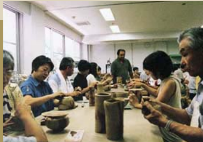
日本を代表する陶芸である備前焼について、その歴史や技法について学習しました。(写真は作品の制作)