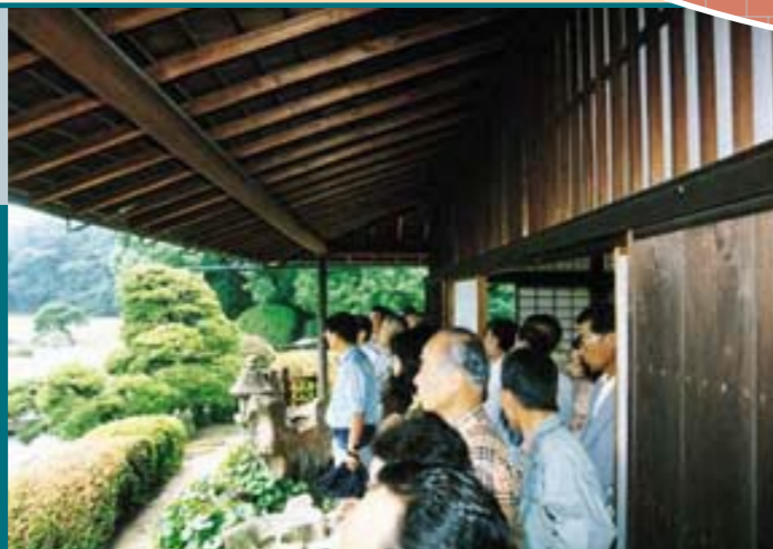
岡山後楽園築庭300年記念事業の一環として、郷土の庭園(案内ボランティア養成講座)を学習しました。(写真は後楽園の見学)