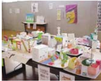
岡山後楽館中等部全生徒美術作品展