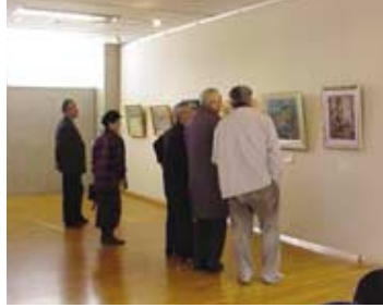
岡山美術研究会作品展

絵画や書道、生け花等、学校や文化サークルといった様々な団体の作品発表や、夏休み環境館など参加型の利用もありました。(45団体)