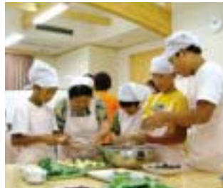
ふかし饅頭づくり

推進をテーマに、山村の資源を活用した実体験を通じて、チャレンジする心と創意工夫をしながら自主的に考える子どもを育成します。この山の学校は、子どものためだけではなく、広く各世代の方に理解してもらうため、次の三つの基本理念で体験メニューを構成しています。