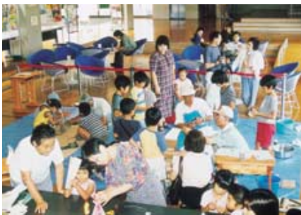
マンスリー・トライアル

生涯学習ボランティアとして、パソコン講座のアシスタント、イベントのお手伝い、自主講座(ばる塾)の企画運営など、当センターを中心に活動しました。