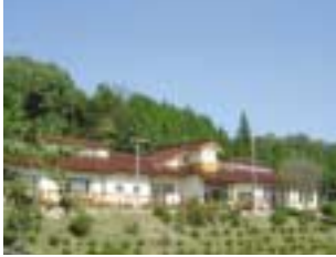
さくとう山の学校