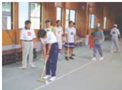
ゲートボール指導者講習会