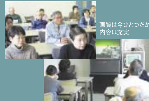
画質は今ひとつだが、内容は充実