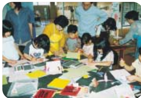
とび出すメッセージカードを作ろう

1月 「ミニ凧づくり」「お猿のおもちゃ飾りを作ろう」 「ブーメランを作って遊ぼう」