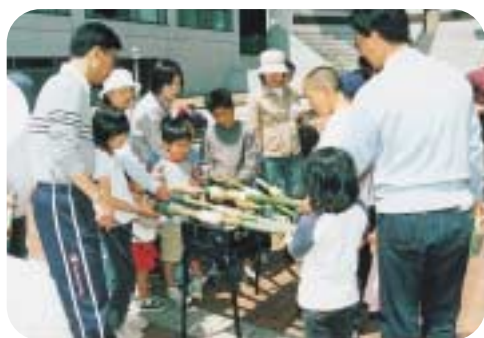
サバイバルクッキング(バンブークーヘン作り)

10月 「ハローウィンの飾りを作ろう」 「サバイバルクッキング」 「変身ペープサートを作ろう」