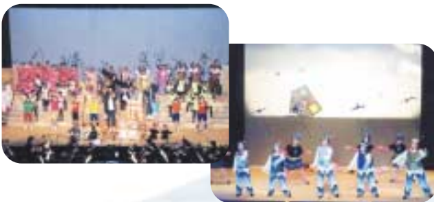
ミュージカル「黒媛物語」(写真左)と子どもミュージカル「オズの魔法使い」の一場面 公演日：黒媛物語 11月下旬(日) オズの魔法使い 3月下旬(日)

スタッフ・キャストから演出に至るまで、町民の手により、オズの魔法使いでは、小学生以下の