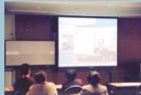
会場:北房町民センター

北房町では、平成15年6月にオープンした町民センターで県生涯学習大学のふるさと発見学「岡山の伝統工芸と技術」を受信、講義に参加しています。 今まで、学習意欲はあっても町民のみなさんがなかなか町内でこういった講義を受ける機会に恵まれていませんでした。受講者は10名余りとあまり多くはないですが、受講していただいているみなさんには講師に直接質問ができる等、大変喜んでいただいています。