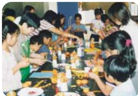
ハローウィンの飾りを作ろう

11月 「牛乳パックでけん玉を作ろう」 「染め物をしよう」「しゃぼん玉で遊ぼう」 「手話ってなあに?」