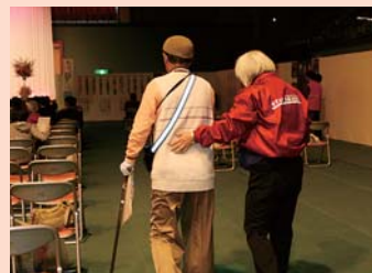
会場係のスタッフ

平成19年11月には岡山県で第19回全国生涯学習フェスティバルが開催されました。赤磐市でも、11月2日(金)～6日(火)にかけて多彩な生涯学習イベントが開かれました。赤磐市女性の会としては、このイベントに参加するのではなく、参画することを選びました。具体的には、3日(土)4日(日)の「赤磐市生涯学習フェスティバル」では、司会進行係、出演者係、会場係、準備係など、運営スタッフとして大会を支えました。2日間という長丁場で、苦勞も多かったのですが、市内のたくさんの方と出会うことができ交流の輪が広がりました。