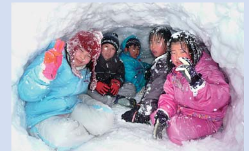
かまくらの中で記念撮影

清流高梁川でのカヌー体験は、夏休みの始まりにふさわしい体験として定着している事業です。子どもたちは、カヌーや水の生き物観察に挑戦し、クラブのお父さんたちが作った焼きそばとかき氷を味わい大満足の1日でした。