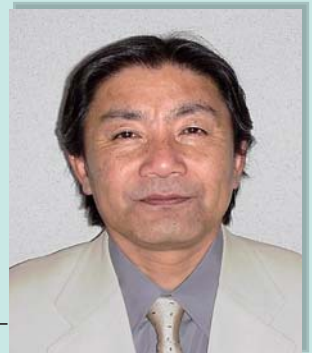
講師プロフィール

小学校教員、生涯学習・社会教育行政を経験。学校と家庭・地域を結ぶシステム・コーディネーターとして全国で活躍。