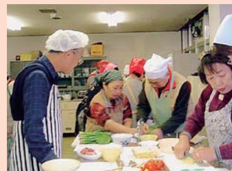
みんなで仲良く料理教室

簡単な料理を楽しい雰囲気の中で体験できるように工夫しました。また、調理技術を伝えることにより日常生活にも役立つことができるメニューにしました。一人暮らしの方、介護中の方、障害者の方など、いろいろな生活環境の方が参加されるので、一人ひとりの思いや願いを聞きながら、料理教室を進めていきました。参加者と会員がよりよい人間関係を築いていくことにより、「あれは楽しかった。」「また企画して。」などの声が届けられています。