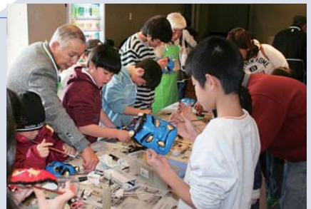
三学ばるマンスリー・トライアル