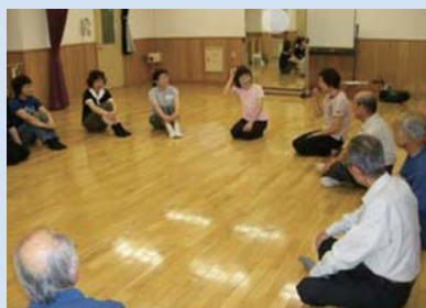
平成19年度 主催講座 「21世紀のくらしと文化」