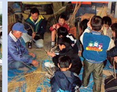
稲わらを利用してお飾り作り