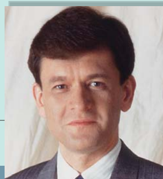
講師プロフィール

1952年アメリカアイダホ生まれ、ユタ州育ち。アメリカ・ブリガムヤング大学大学院で経営学修士号を取得。MBS「世界まるごとHOWマッチ」に出演、一躍有名人に。趣味はスキーをはじめ、スポーツも万能。ピアノはプロ級の腕前。最近では、日米の関係などを始め多数のテーマで執筆や講演活動をしている。