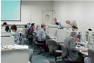
P.S.S.R. (パソコンセルフスタディールーム)