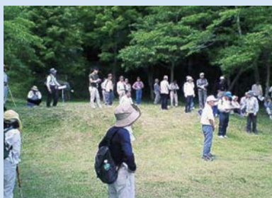
平成19年度 主催講座 「美作の中世山代を訪ねて～その盛衰と遺構と～」