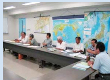
平成19年度 主催講座 「生涯学習とまちづくり」