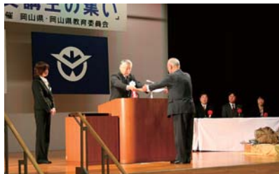
生涯学習「受講生の集い」