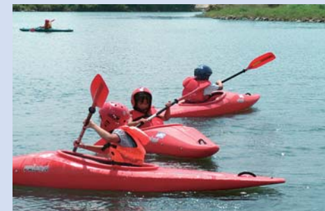
清流高梁川でのカヌー教室

平成13年にPTAのお父さんたちが集まって結成されました。現在16名で活動しています。小学校の親子を対象にした体験事業とお父さんたちの親睦を深める定例会を中心にして、青少年健全育成と保護者同士のコミュニケーションを目標に活動しています。主な事業は夏にカヌー体験、秋に野外炊事、冬に雪遊び体験と大変充実しています。実施するまでには大変な計画と準備を要しますが、自分たちも楽しむことを忘れずに取り組んでいます。