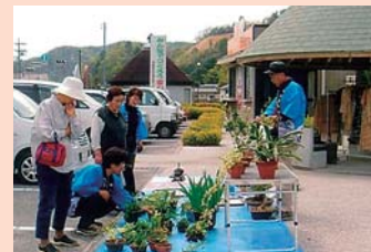
ふれあいなかよし市

赤磐市女性の会会員と地域が共に元気が出ること、たくさんの仲間ができることを目的に“いきいき、まちきらり”街づくり活動を展開しました。それが、「ふれあいなかよし市」です。具体的には、地域の手作り農産物・手芸品・家庭の中の不用品でリサイクルできるもの等に出品者が値段を付けて出します。また、地元の青空市より若干？低価格で出品し、会員が販売を担当します。市の開催は毎月第二土曜日で、場所は赤磐市所有の無人の建物を借り受けました。利用者からは、「私らの年金で買える。楽しみができた。」「安くて新鮮な野菜じゃなあ。」「私の作った物を喜んで買ってもらえたら嬉しいわあ。」「私の作った草履が売れたん。ほんならまた、元気を出さやあおえんなあ。」等々好評でした。しかし、平成20年度から、無償ボランティアで管理していた建物は、指定管理者が決まり、現在、なかよし市は休眠に入りました。楽しみにしていただきた人々に感謝しながら今、なかよし市をたてる場所を探しているところです。