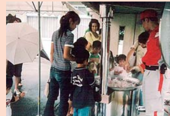
炊き出し体験(日赤岡山支部協力)

次の4つのことをねらいとして夏休みに開催しました。【①夏休み中に一日でも安心して子どもたちが過ごせる居場所の提供。②参加する事で防災の知識が身につく。③遊びの種類が増える事で、友だちと遊び合うきっかけづくりができる。④親子、家族が生活に密着した体験ができ家族間の話題が増える。】日赤岡山支部の方をお迎えしての炊き出し体験、親子ふれあいレクリエーション、親子で防災について考える集いなど、様々なプログラムを提供しました。今後の課題としては、合併前からの活動ですが、回を重ねる毎に参加者が増加傾向にあり、内容がマンネリ化しないように企画していくことや働く両親や家族に興味関心をもってもらえるような内容を今年も考えています。