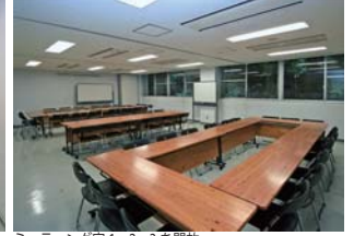
ミーティング室1・2・3を開放