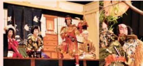
これぞ歌舞伎のまちの職員という迫真の演技

奈義町役場有志職員が、昨年11月の歌舞伎大公演と今年2月に勝央町で行われた冬の公演で「絵本太功記十段目」を熱演しました。連日、意気込みも盛んに夜遅くまで舞台稽古を繰り返し、公演当日には目の肥えた観客を唸らせる迫真の演技を披露しました。