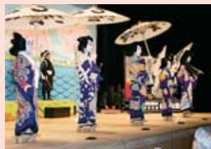
白浪五人男の名台詞を披露

るもおこがまいが」の名文句で有名な「白浪五人男」を冬の公演で演じ会場から大きな拍手を受けました。