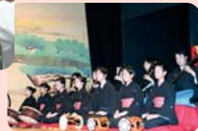
三番叟の太鼓、お囃子、三味線演奏