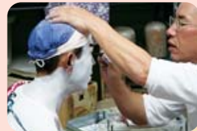
役者に化粧をする顔師

横仙歌舞伎は、江戸時代より県北部中国山地の農村地域を中心に神社境内にある舞台などで演じられてきた歌舞伎のことです。現在では、横仙歌舞伎保存会や松神会、さらに、2名の役場歌舞伎専門職員等が中心になり、子どもから大人まで多くの人々が歌舞伎に関わり、伝統を大切にしたまちづくりに生かしています。