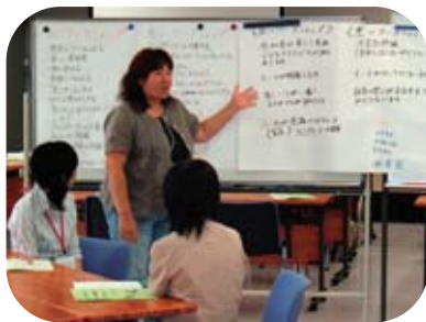
生涯学習推進専門講座