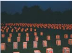
絵柄灯笼に火を入れた

今年も8月下旬に吉備高原夢祭り実行委員会が中心となり第16回「鬼伝祭」が行われる予定です。益々地域づくりのため、吉備高原をアピールするために活躍されることでしょう。