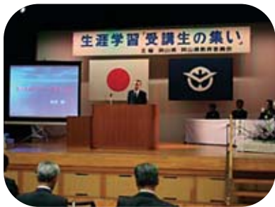
生涯学習「受講生の集い」