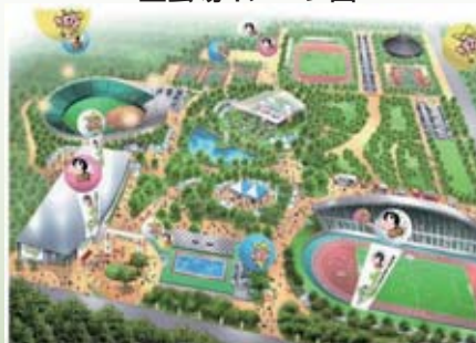
主会場イメージ図