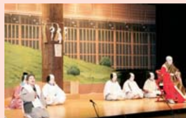
横仙歌舞伎大公演

歌舞伎公演の当日は、舞台役者、語りを行う義太夫、三味線弾き、舞台大道具、小道具の製作者、衣裳着付師、かつらを扱う床山、独特の化粧を施す顔師等の大所帯となり、それぞれ目に見えないところで互いに支え合っています。