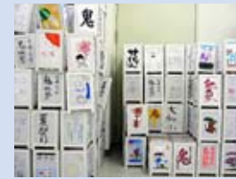
山のように積み上げられた絵柄灯笼

平成4年吉備高原都市に賑わいを、また各地より集まってきた地域住民、地域企業との一体感を持つためにこの「きびプラザ」を会場に始まったイベントが「鬼伝祭」です。「鬼伝祭」の由来は吉備高原に伝わる鬼の様々な伝説をもとに、鬼