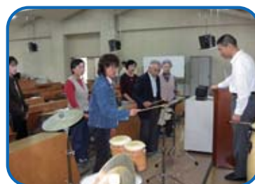
平成18年度主催講座 「アートを楽しむ」