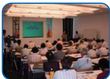
平成18年度主催講座 「満喫・感動にいみの宝もの体験学習」