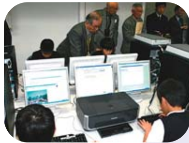
伊島小との学社融合研究モデル事業