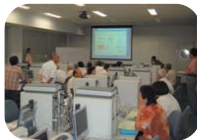
パソコン指導者養成講座