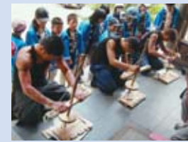
古式ののっとり鬼火を採火

をモチーフにして生まれた祭です。この祭は「吉備高原夢祭り実行委員会」が中心になって企画・運営しています。この実行委員会は吉備高原都市にある団体、企業、商店や地区住民に働きかけて代表を出してもらい、「鬼伝祭」について協議していくものです。それぞれの団体、企業、商店や地区住民の持ち味を發揮し、地域の活性化、地域社会に連帯化を進める上で、すばらしい取り組みをしています。