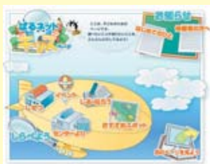
キッズページトップ画面