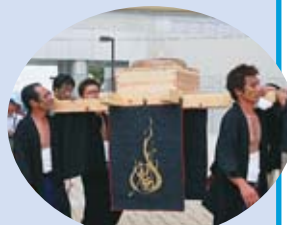
御輿が会場に到着

一昨年までは秋に行われていたこの祭を昨年からは夏に行うことに決め、夏の吉備高原をアピールするイベントとしました。15回目を迎えた昨年の「鬼伝祭」では、岡山三大祭の一つ「吉川当番祭」が行われる吉川八幡宮で商工会青年部が宮司さんより祝詞を挙げていただき、古式ののっとり「まいぎり式」で