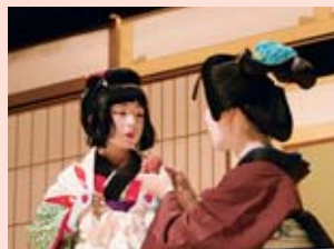
「阿波の鳴門」での演技に会場は涙の渦

また、小学校3年生の総合的な学習の時間で町歌舞伎専門職員から指導を受けた子ども達の有志が、「問われて名の