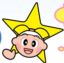
岡山県マスコット ももっち