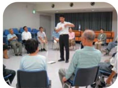
生涯学習ボランティア養成セミナー