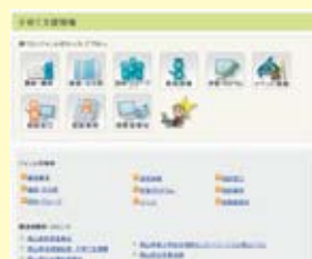
子育て支援専用ページ