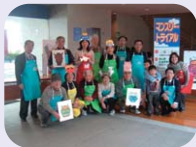
三学ばるマンスリー・トライアル (19.2.3 運営したばるボランティアのみなさん)