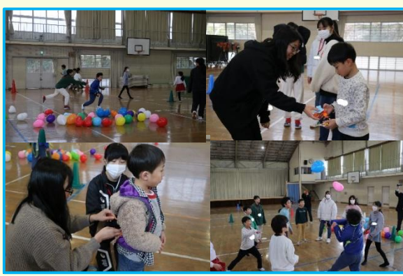
小学生を対象にオリジナルゲームを実施