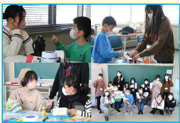
小学生を対象に工作を実施