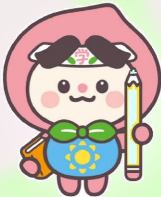
岡山県生涯学習センター キャラクター「ももらん♪」