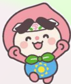
岡山県生涯学習センター キャラクター「ももらん♪」