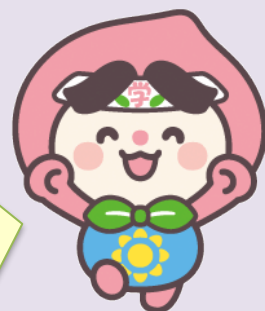
岡山県生涯学習センター キャラクター「もらん♪」